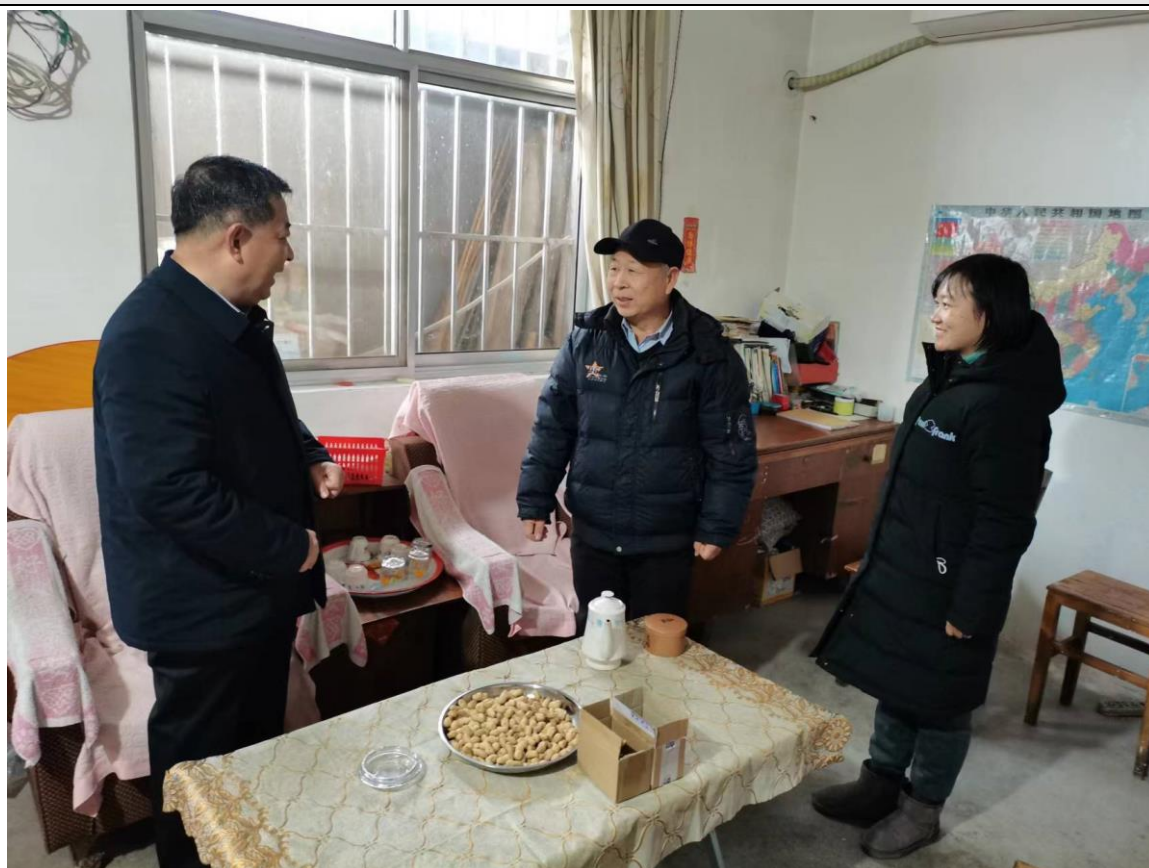
图 4-5 临沂艺术学校副校长与驻村同志慰问老党员

自 2020 年以来，临沂艺术学校积极派驻党员教师参与“加强农村基层党组织建设”工作，驻点同志积极参与工作组的各项工作，临沂艺术学校也对驻点同志及其所在工作组的工作给予了大力支持，积极服务乡村振兴，为党的事业尽兴尽力，为农村建设舔砖加瓦。