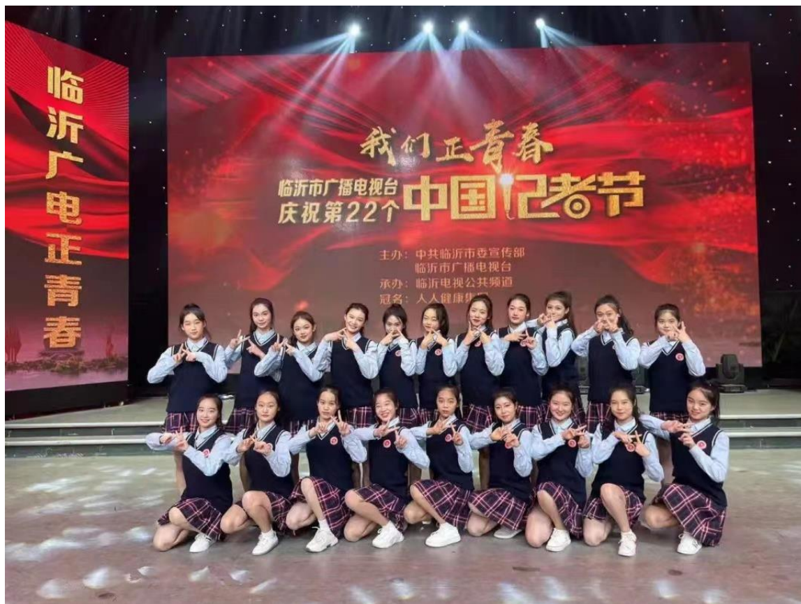
图 4-1 临沂艺术学校学生参加庆祝第 22 个记者节演出活动