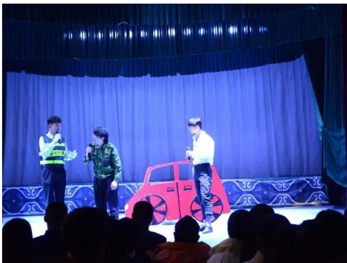
图 1-5 临沂艺术学校“全国交通安全日”主题宣讲活动

学校积极推进公民道德教育，在学生日常行为规范与文明礼仪教育中涵养学生的道德品质，开展安全教育、环境保护等专题教育，培养合格公民。与此同时，学校高度重视法治教育，通过“学宪法 讲宪法”等主题活动引导学生加强法纪意识。