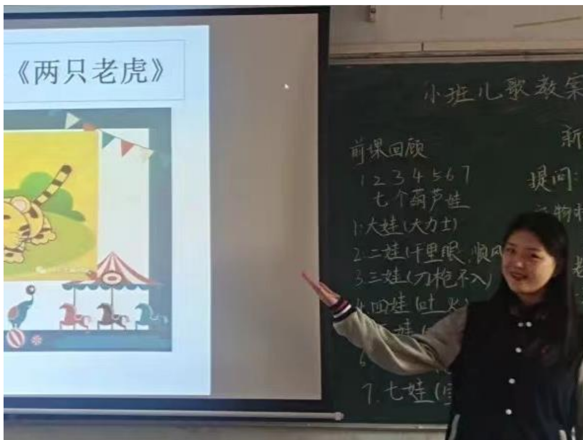
图 2-4 临沂艺术学校信息化教学能力大赛

与此同时，学校进一步提升师生信息化素养。组织教师积极参与各级各类教育教学信息化技能大赛，在 2021-2022 学年获得省级奖项 1 项，市级奖项 4 项。学校也高度重视对学生进行信息化能力培训，举办信息化教学能力大赛，进一步提高了学生的专业实践与信息化水平。