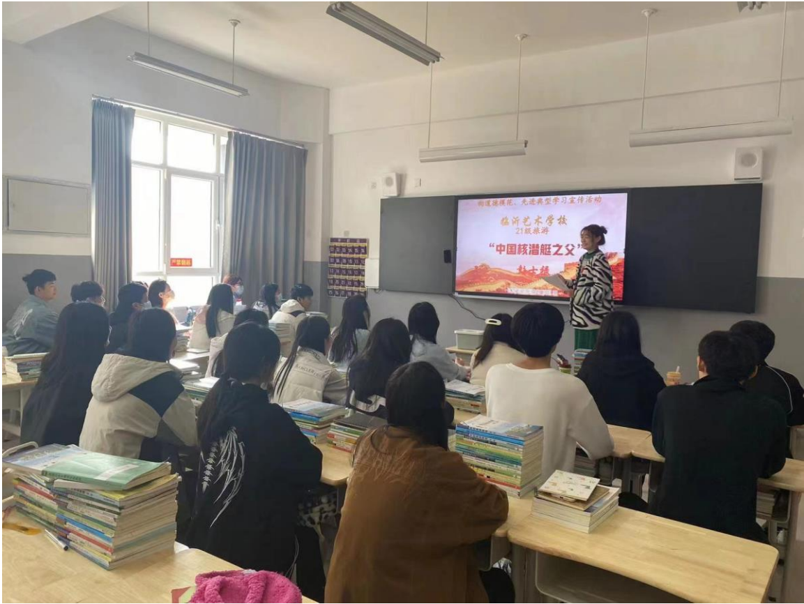
图 1-3 “匠心筑梦 匠艺强国”工匠精神我来讲活动