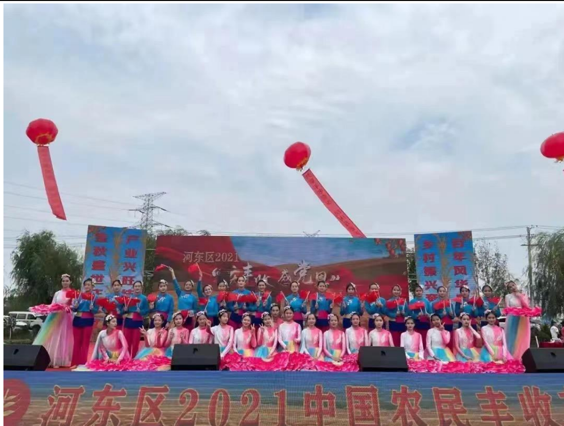
图 4-4 临沂艺术学校学生参加中国农民丰收节开幕活动