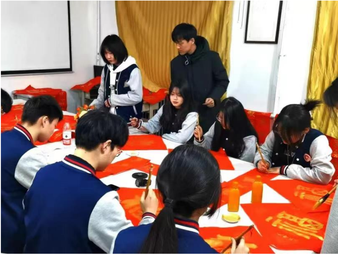
图 1-4 “迎新春 送祝福”书法实践活动