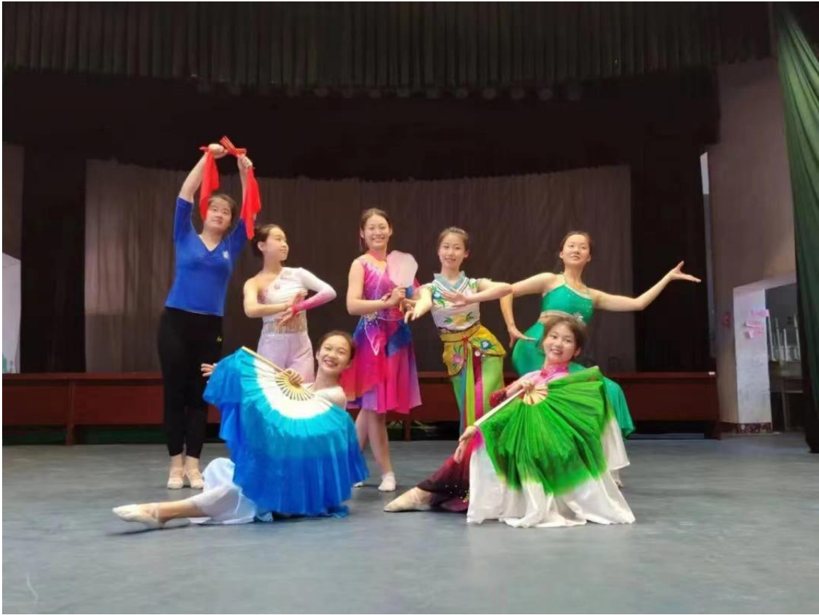
图 2-3 临沂艺术学校技能大赛比赛现场