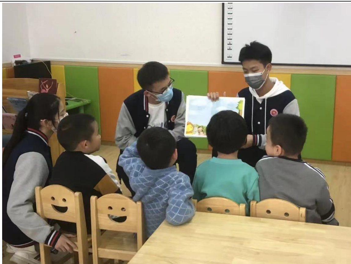
图 4-6 临沂艺术学校学生与康复中心小朋友互动