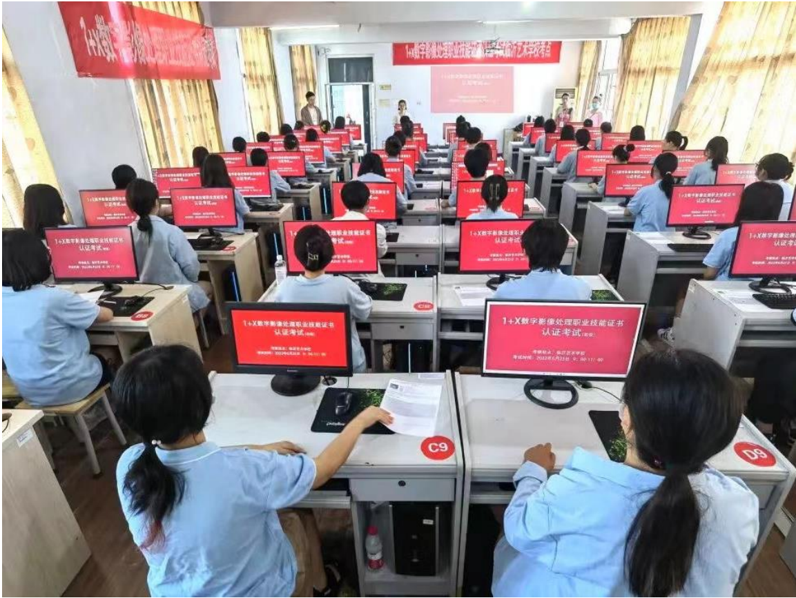
图 2-2 临沂艺术学校“1+X”证书考试现场

与此同时，各专业教学部鼓励学生积极参与各级各类技能大赛，组织校级选拔赛，做好市级、省级比赛的训练提升与后勤保障工作，有效提高了学生的专业技能课程学习积极性和成效。