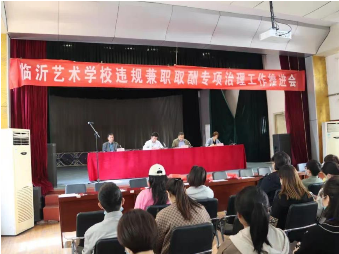
图 2-5 临沂艺术学校违规兼职取酬专项治理工作推进会