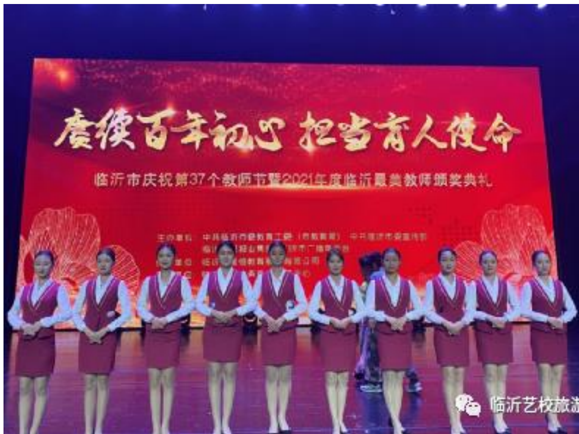
图 4-3 临沂艺术学校“清·雅”礼仪服务队在服务现场