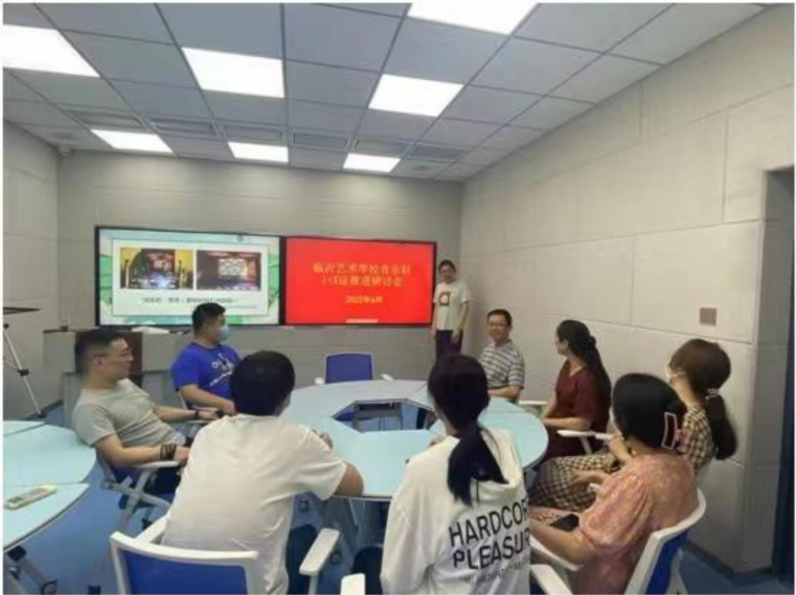
图 2-1 临沂艺术学校“1+X”证书考试融通课程研讨会

另一方面，学校依托“课程思政”教学能力比赛，积极推进课程思政示范课建设，进一步推进了思政课程与课程思政建设同相协调发展。本年度，学校将历年临沂市职业院校技能大赛教学能力比赛获奖作品经验在全校范围内推广，对思政教师团队作品《大道之行——参与政治生活，共享美好明天》、历史教师团队作品《共忆奋斗峥嵘史，重走建党百年路》进行优化与提升。推动各专业教学部积极探索专业课程融入课程思政建设的有效路径，并取得显著成效。美术部辛玥颖老师的课程思政教学作品《“红船映初心 青春心向党”主题海报设计——色彩的采集与重构》获临沂市教育教学信息化技能大赛一等奖、山东省教育教学信息化交流展示活动一等奖，杨雪晴老师的课程思