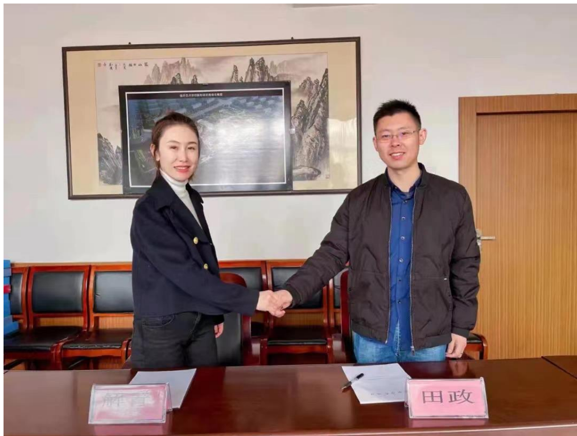
图 2-6 临沂艺术学校与临沂云乐文化传播有限公司签订校企合作协议