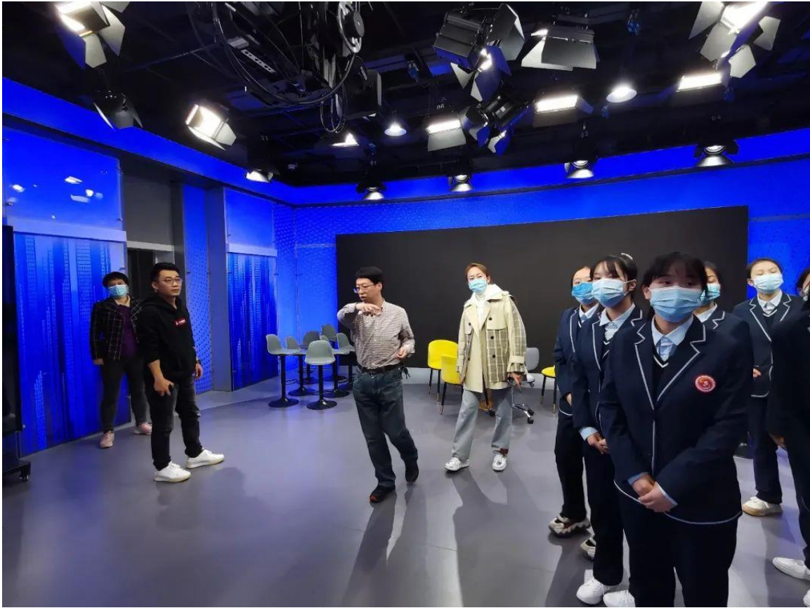
图 1-7 临沂艺术学校师生走进临沂市广播电视台参观学习