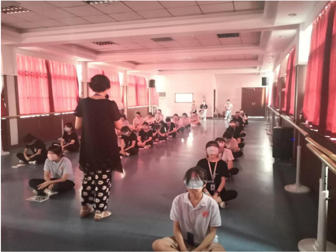
图 1-6 临沂艺术学校“心理健康节”系列活动