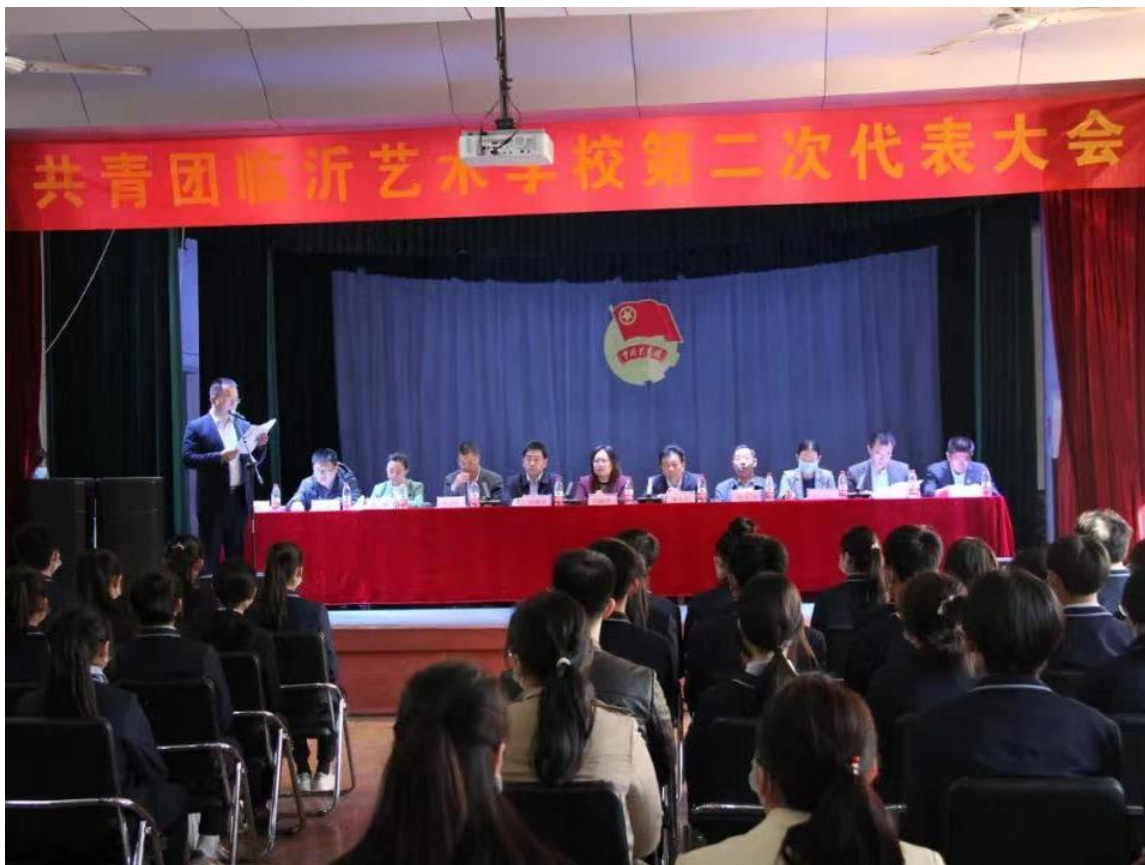
图 1-1 共青团临沂艺术学校第二次代表大会召开

（1）以党建带团建，完善群团组织建设和。在共青团临沂艺术学校第一次代表大会的基础上，召开第二次团代会，进一步完善各专业教学部的团组织建设和，优化团员管理工作机制，增强了团组织的吸引力和凝聚力。