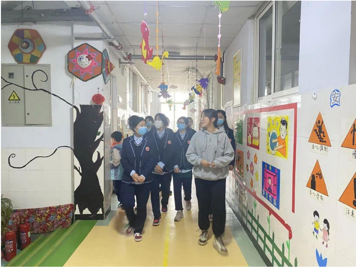
图 2-7 幼儿保育专业学生在小龙人幼儿园进行实训